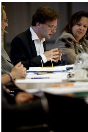
Tweede Kamerlid Ronald van Raak